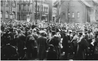
Truppenansammlung in Castrop-Rauxel, 1923

Der Vortrag beleuchtet die schwierige Lage Frankreichs in den frühen 1920er Jahren. Diese waren keineswegs nur davon geprägt, dass Frankreich seit dem Vertrag von Versailles als triumphale Siegermacht Anspruch auf eine hegemonale Politik in Europa erhob, vielmehr hatte